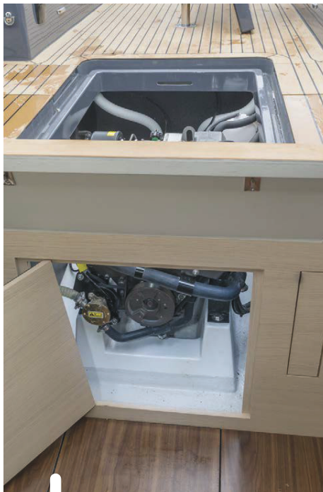
De Yanmar dieselmotor is uitstekend te bereiken, zowel via een kuipvloerluik als een luik binnen.