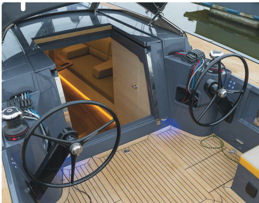
De stuurman zit op de eerste rang met de volledige bediening van de boot binnen handbereik.

buiten wordt in het interieur voortgezet. Geen detail te veel; stijlvol minimalisme wat ons betreft. De 37 heeft een lage romp, maar het beschikbare volume is optimaal benut. Je kunt deze boot met een gerust hart een weekende meenemen met z'n tweeën, zonder het gevoel te hebben iets tekort te komen - een zeer luxe dagzeiler. Zo is er een prominente 'koffiebar' in de kombuis, voldoende koelruimte, een tweepits inductiekookplaat en op allerlei plekken slimme bergruimtes. Bijvoorbeeld: de behoorlijk grote wasborden van de kajuitingang berg je in een nis achter een subtiel klepje naast de trap. De kooien zijn lang genoeg en de toiletruimte met wasbak volstaat prima. Het strakke werkblad in de natte cel wordt, evenals het aanrechtblad, gemaakt in een mal. Dat maakt de bladen sterk, vormvast en goed te reproduceren. 📌