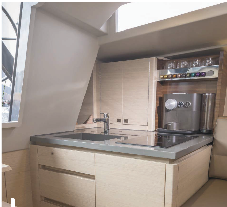
Prominent in de kombuis: de 'koffiebar'. Verder een inductiekookplaat en slimme bergruimtes.

buiten wordt in het interieur voortgezet. Geen detail te veel; stijlvol minimalisme wat ons betreft. De 37 heeft een lage romp, maar het beschikbare volume is optimaal benut. Je kunt deze boot met een gerust hart een weekende meenemen met z'n tweeën, zonder het gevoel te hebben iets tekort te komen - een zeer luxe dagzeiler. Zo is er een prominente 'koffiebar' in de kombuis, voldoende koelruimte, een tweepits inductiekookplaat en op allerlei plekken slimme bergruimtes. Bijvoorbeeld: de behoorlijk grote wasborden van de kajuitingang berg je in een nis achter een subtiel klepje naast de trap. De kooien zijn lang genoeg en de toiletruimte met wasbak volstaat prima. Het strakke werkblad in de natte cel wordt, evenals het aanrechtblad, gemaakt in een mal. Dat maakt de bladen sterk, vormvast en goed te reproduceren. 📌